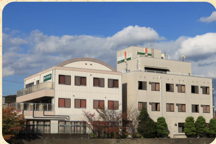
介護老人保健施設カルフル・ド・ルポ