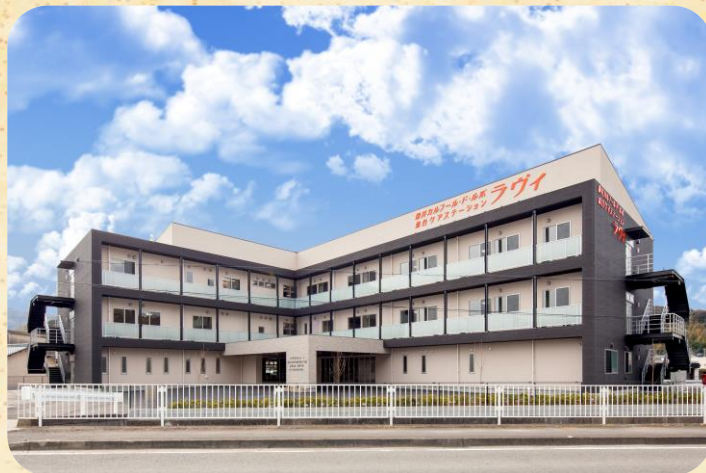
総合ケアステーション ラヴィ